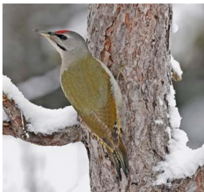
Oiseaux: pic cendré