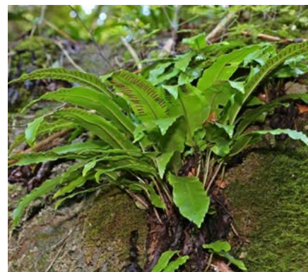
Fougères: langue de cerf