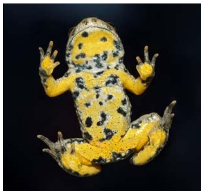
Batraciens: sonneur à ventre jaune